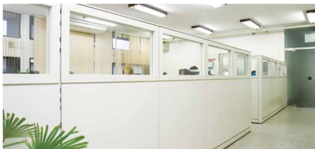
Divisórias meio-vidro compõem o novo layout do Departamento de Recursos Humanos