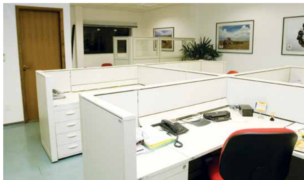
O melhor aproveitamento da área do Escritório de Motores permitiu criar novas estações de trabalho