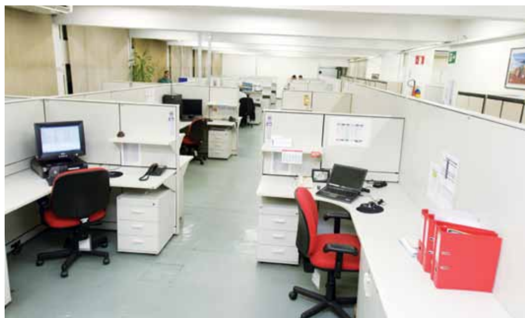
Estações de trabalho em formato de células permitem a maior integração dos colaboradores da Engenharia