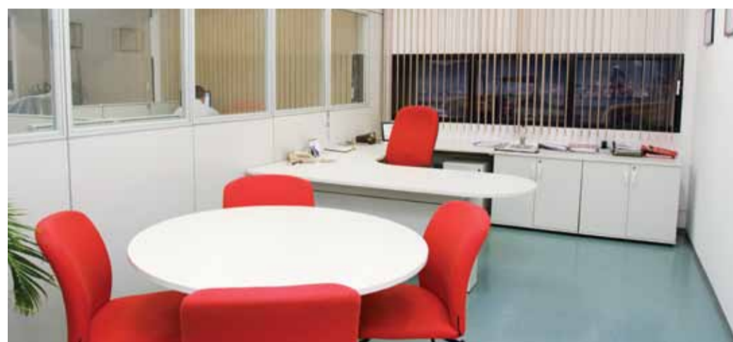
O Escritório da Engenharia de Processos recebeu novo mobiliário, proporcionando melhores condições de trabalho