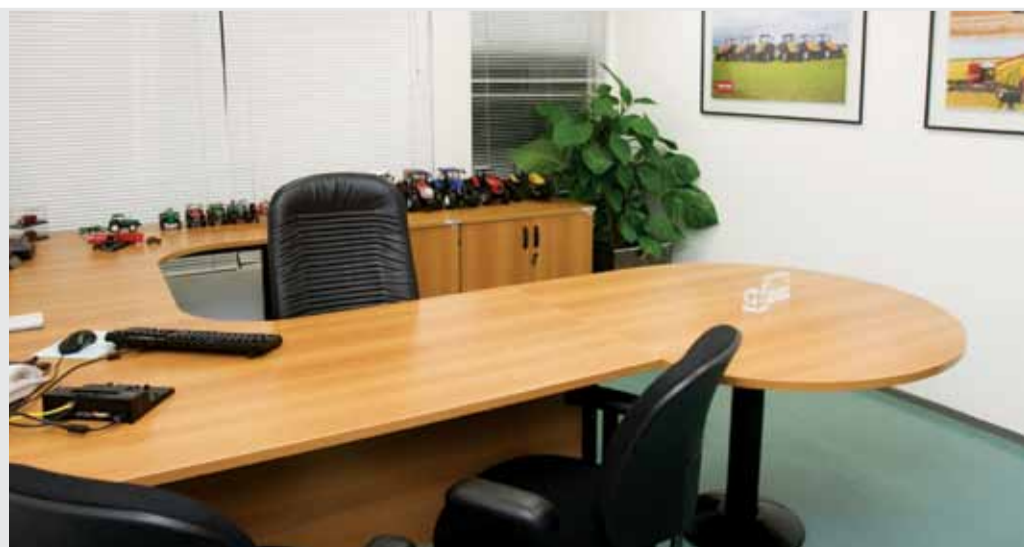
O novo prédio do Escritório de Motores ganhou novas salas e ambientes mais harmoniosos que oferecem maior flexibilidade a toda a equipe